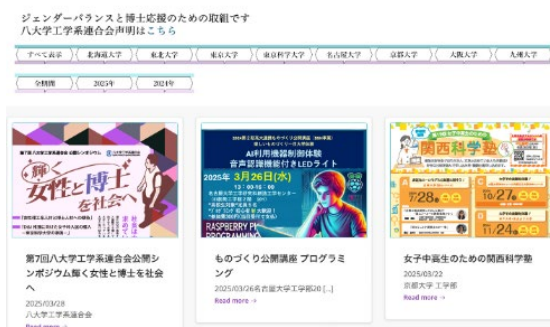
新設ウェブサイトのトップページ